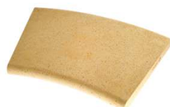
Margelle courbe profil Plat