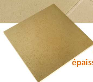
Dalle 50x50 épaisseur 2,5 ou 3,5cm (+/- 3mm)