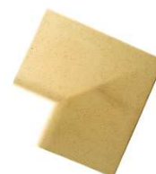
Angle 90° profil Galbé