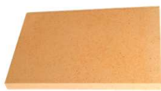
Margelle droite profil Plat