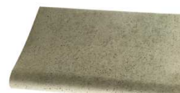
Margelle droite Profil Galbé